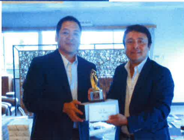
29.10.12 親睦ゴルフコンペ 鴻巣カントリークラブにて（埼玉県鴻巣市）