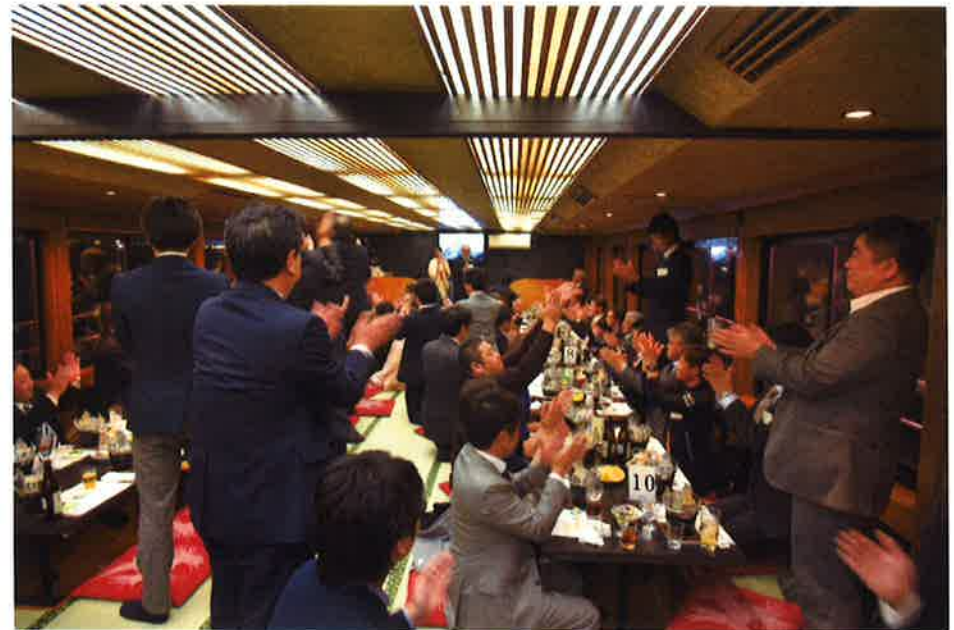
29.2.24 10周年記念祝賀会 屋形船「晴海屋」にて（お台場）

各方面のご支援の平成29年2月、10周年記念式典を当会らしく、屋形船で実施し81名の参加者で晴れやかにお祝いしました。